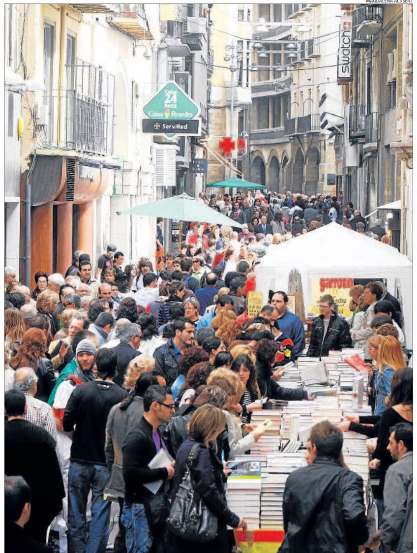
La calle Major de Lleida volvió a concentrar el interés de miles de personas en busca del libro y la rosa.