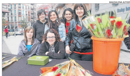
Una de las numerosas paradas de venta de rosas ayer en Lleida.