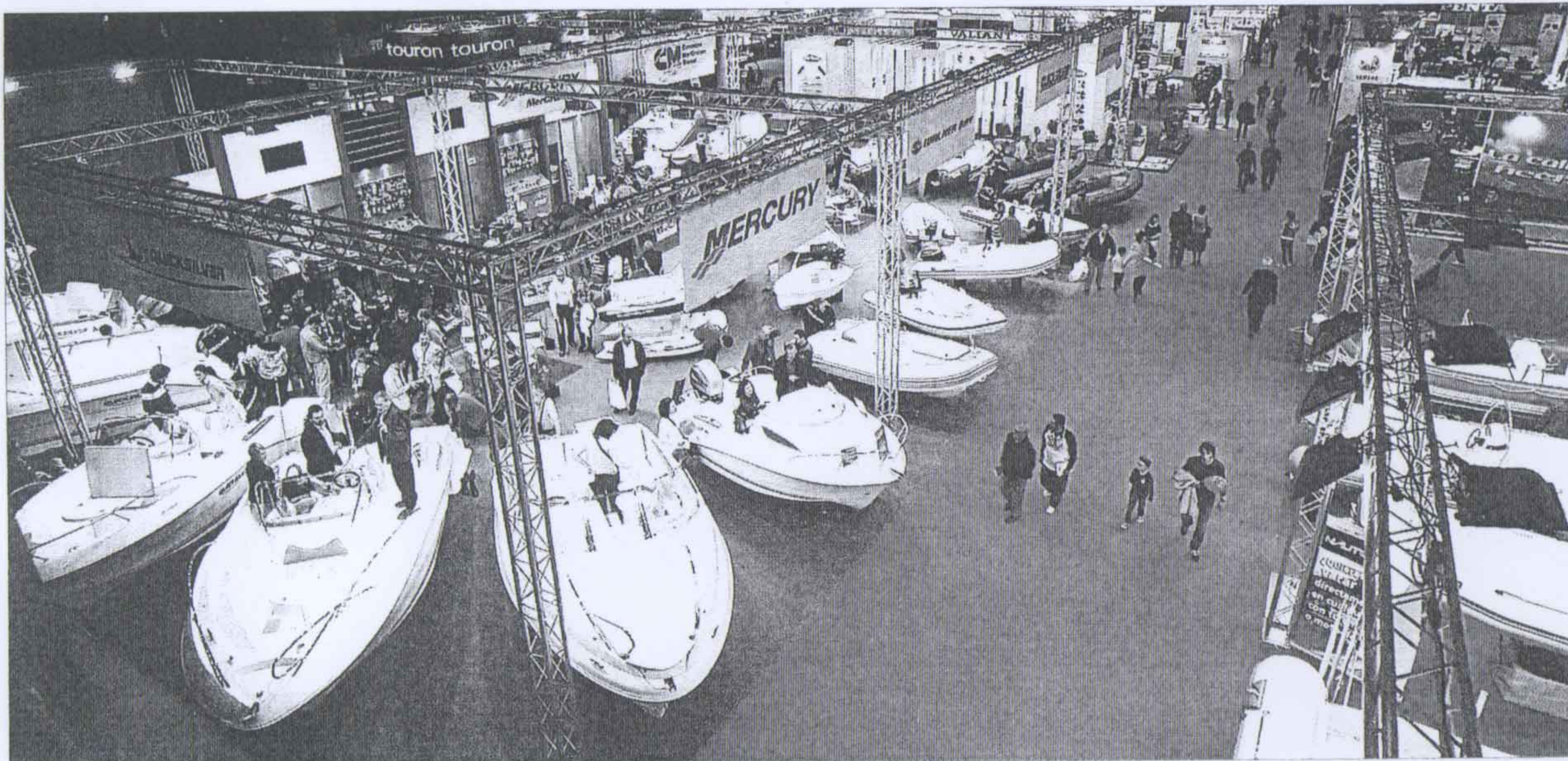
► Imatge general del recinte firal que acull des d'ahir la 48a edició del Saló Nàutic de Barcelona, a les instal·lacions Gran Via 2, a l'Hospitalet.

FIRA DE BARCELONA ACULL LA 48a EDICIÓ DEL CERTAMEN